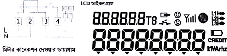
মিটার কালেকশন দেওয়ার ডায়গ্রাম