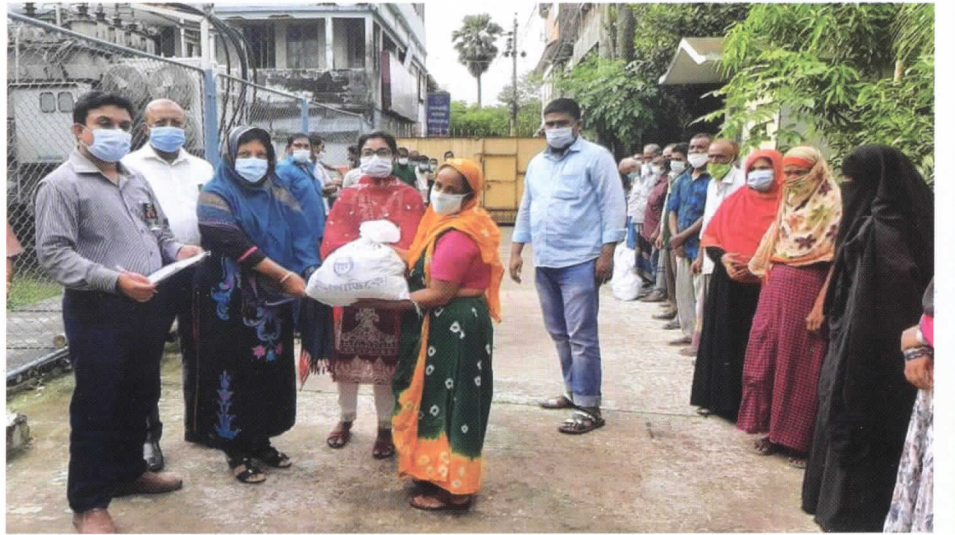
১৫ আগস্ট, ২০২১ জাতীয় শোক দিবস উপলক্ষে ওজোপাড়িকোর পক্ষ থেকে দুস্থ ও আর্থিকভাবে অস্বচ্ছল পরিবারকে ত্রাণ সামগ্রী বিতরণ করা হয়

কোভিড-১৯ পরিস্থিতিতে লক ডাউনসহ অন্যান্য প্রতিকূল পরিস্থিতিতে ছিন্নমূল মানুষেরা কর্মহীন হয়ে পড়েছে। এক বিরাট অংশের জনসাধারণের দৈনিক আয় শূন্য হয়ে পড়েছে। এরূপ এক পরিস্থিতিতে সরকারের পক্ষ থেকে নানা ধরনের প্রণোদনাসহ ছিন্নমূল জনসাধারণের মধ্যে ত্রাণ বিতরণের বিষয়টি গুরুত্ব পেয়েছে। এরই অংশ হিসাবে বিদ্যুৎ বিভাগের আওতাধীন বিভিন্ন সংস্থা/কোম্পানী ছিন্নমূল মানুষের মাঝে জাতীয় শোক দিবস উপলক্ষে ত্রাণ বিতরণের উদ্যোগ গ্রহণ করেছে। সে অনুযায়ী ১৫ই আগস্ট, জাতীয় শোক দিবসে বিদ্যুৎ বিভাগের আওতাধীন প্রতিষ্ঠান হিসাবে ওয়েস্ট জোন পাওয়ার ডিস্ট্রিবিউশন কোম্পানি (ওজোপাড়িকো)-এর অধীনস্থ ছয়টি পরিচালন ও সংরক্ষণ সার্কেল এবং সদর দপ্তরের মাধ্যমে প্রায় ১২০০টি পরিবারকে ত্রাণ বিতরণের উদ্যোগ গ্রহণ করে। ত্রাণ সামগ্রী হিসাবে প্রতিটি ব্যাগে চাউল, ডাউল, সয়াবিন তেল, লবণ, আলু ইত্যাদি বিতরণ করা হয়।