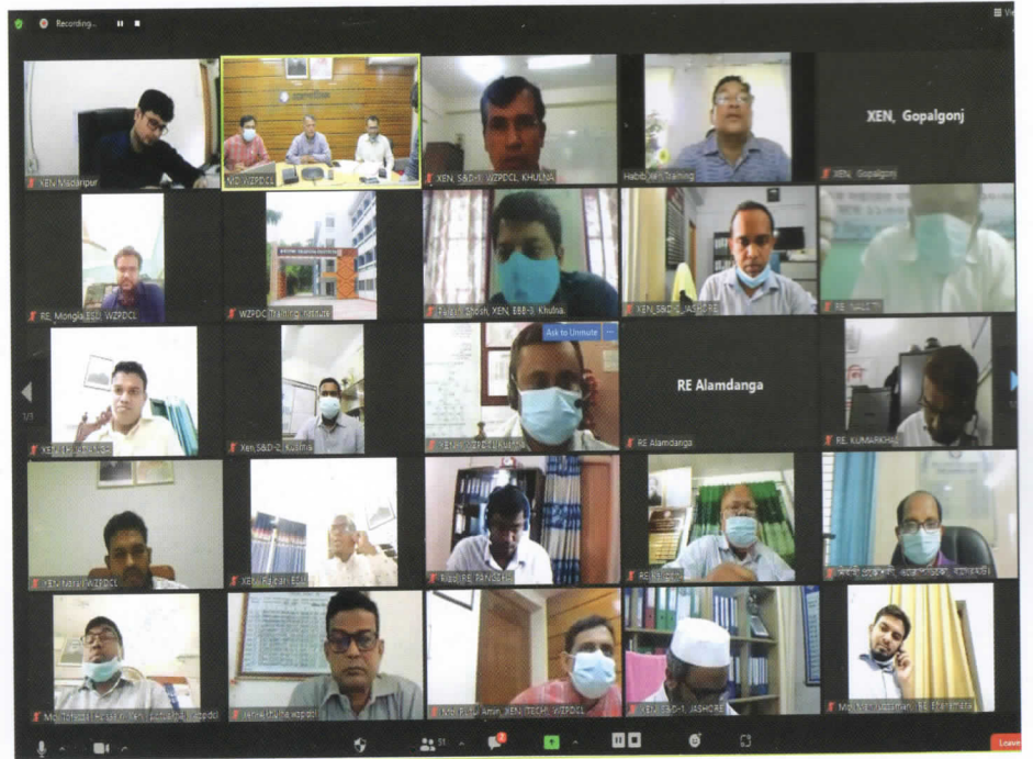
ওজোপাড়িকোর কর্মকর্তাগণের জন্য Annual Performance Agreement (APA) শীর্ষক প্রশিক্ষণ অনুষ্ঠিত