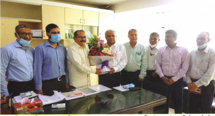
ওজোপাডিকো'র নবনিযুক্ত ব্যবস্থাপনা পরিচালককে ফুলেল শুভেচ্ছা জানাচ্ছেন ওজোপাডিকো'র চেয়ারম্যান ও উর্ধ্বতন কর্মকর্তাগণ

প্রায় ০৫ মাস পর ওজোপাডিকোতে ব্যবস্থাপনা পরিচালকের পদ পূর্ণ হলো। গত ০২ মে, ২০২১ তারিখে পূর্ববর্তী ব্যবস্থাপনা পরিচালকের চাকুরী বয়স পূর্ণ হওয়ায় তিনি অবসর গ্রহণ করেন। এরপর অন্তর্বর্তীকালীন ভারপ্রাপ্ত ব্যবস্থাপনা পরিচালক হিসাবে দায়িত্ব পালন করেন